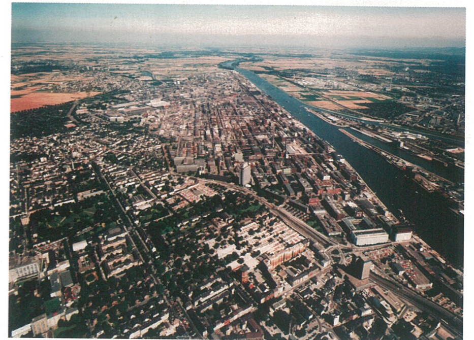
Takhle se průmyslová část životní pouti rýnských vod odvíjí kolem města ve městě – BASF v Ludwigshafenu.

Snad každý z této druhé největší chemiky světa jezdí na kole, mraky bicyklů před vchodem (žádných horských superkol, spíš připomínají nějakého toho junióra po starší sestře) působí jak komáři v Šípkové Růžence, to jest ustrnuví ve svém pohybu. Cestou lemovanou záhadnými plastickými pytli se ubíráme k vysokému baráku, kde se vyrábí dioxid chrómu, který později dosedne na fólie magnetických pásek typu CrO 2 . Ty pytle obsahují vodu s nemrznoucí směsí a jsou určeny k zahzení do kanálu – v případě, že by do odpadních vod pronikaly chemikálie, je možno je takto neutralizovat. Voda je zde rýnská, neboť jsme v Porýní,