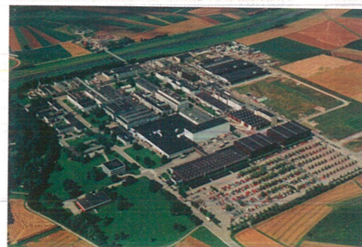
Willstätt, malá úhledná fabrika přísně dbalá ekologických norem.

Fabrika ve městečku Willstätt je už mnohem menší, decentnější a na první pohled méně ukopetná. Jejím posláním je již třicátým rokem polévat široké fólie (dovezené odněkud z asijského východu) kaší, vzniklou z nám již známého ludwigshafenského mouro, tyto nosné fólie pak nařezat na pásky přiměřené šíře (dle typu média) a odeslat do poslední továrny, tentokrát ve francouzském Obenheimu. Krom toho je zde k mání nesmírně zajímavá recyklační